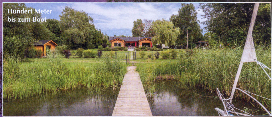
Hundert Meter bis zum Boot