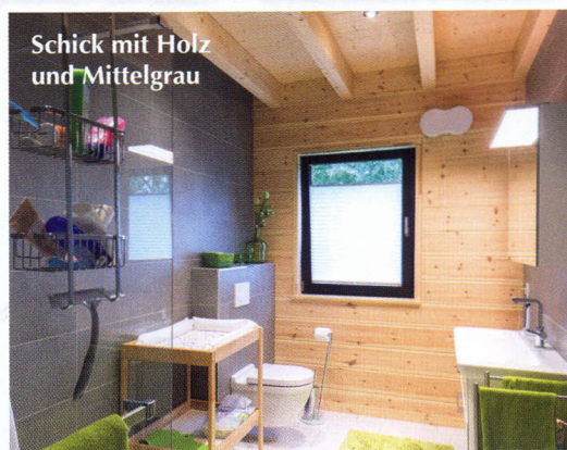
Schick mit Holz und Mittelgrau