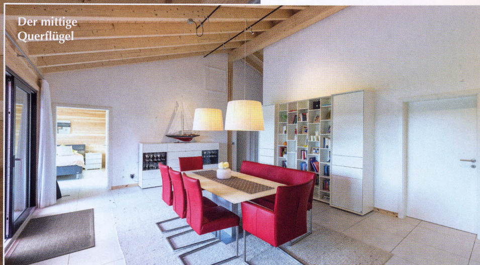
Der mittige Querflügel

Nachdem die Bauinteressierten im Internet eher zufällig ein deutscher Spezialist für Wohnblockhäuser gefunden hatten, ging alles Schlag auf Schlag: Das auf dem Grundstück noch stehende und in die Jahre gekommene Holzhaus wurde abgerissen. Parallel dazu entwarf man ein neues Haus im Bungalowstil mit angedeuteter U-Form. Im Blockhauswerk wurden dann sämtliche Wandelemente vorgefertigt und termingetreu zum Bauplatz geliefert. Dort wurde