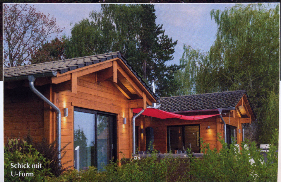
Schick mit U-Form

sie Zeit, das Ferienhaus mit ihren Kindern und Enkeln zu genießen. Immerhin sind alle zusammen zehn Personen, die alle ordentlich untergebracht werden möchten.