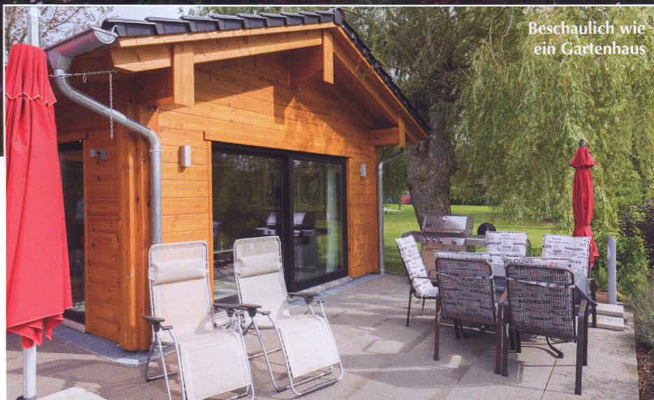
Beschaulich wie ein Gartenhaus

Die Devise für eine Großfamilie im Département Moselle lautet: Entspannung im Blockhaus am See.