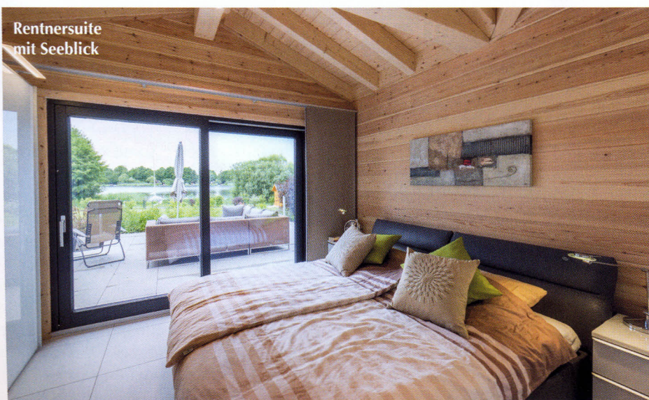
Rentnersuite mit Seeblick

Der U-förmige Satteldachhaus mit 27 cm starken gedämmten Wänden aus nordschweizer Kiefer hat 167 qm ebenerdige Wohnfläche. Das vorgefertigte Massivholzhaus wird mit einer Luftwärmepumpe beheizt.