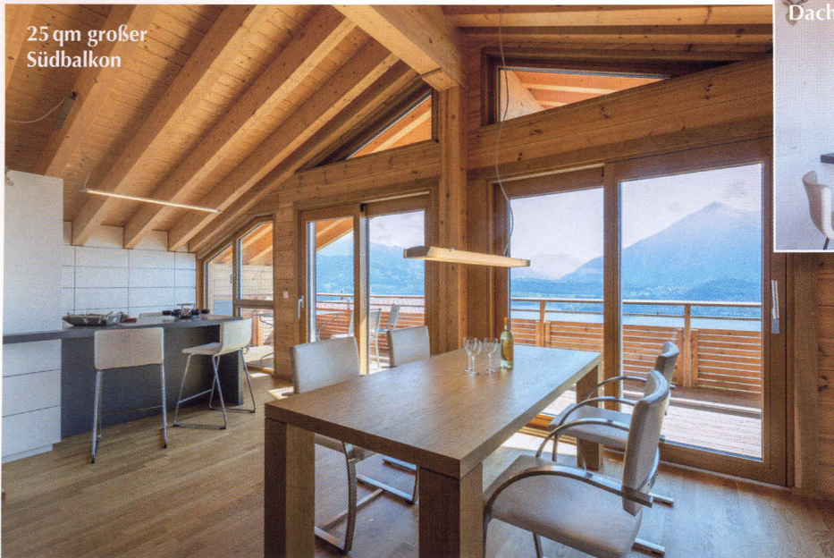
25 qm großer Südbalkon