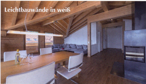
Leichtbauwände in weiß

Ein schöner Farbtupfer sind die braunroten Dächer. Sie wurden für besonders hohe Schneelasten ausgelegt. Die Balkongeländer bestehen aus querlaufenden Holzlatten, wie sie auch andere Häuser im Ort tragen.