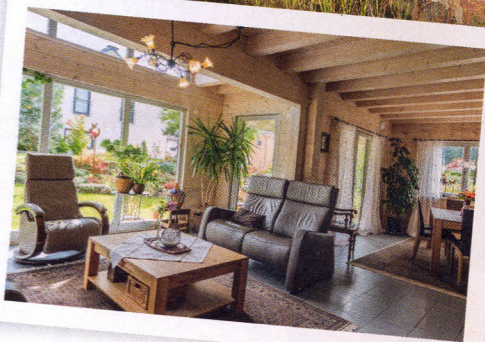
Viel Holz und bodentiefe Fenster lassen das Haus innen gemütlich und hell wirken.