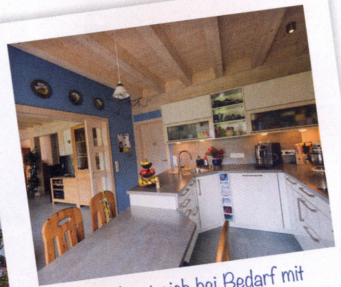
Die Küche lässt sich bei Bedarf mit einer Schiebetür abtrennen.