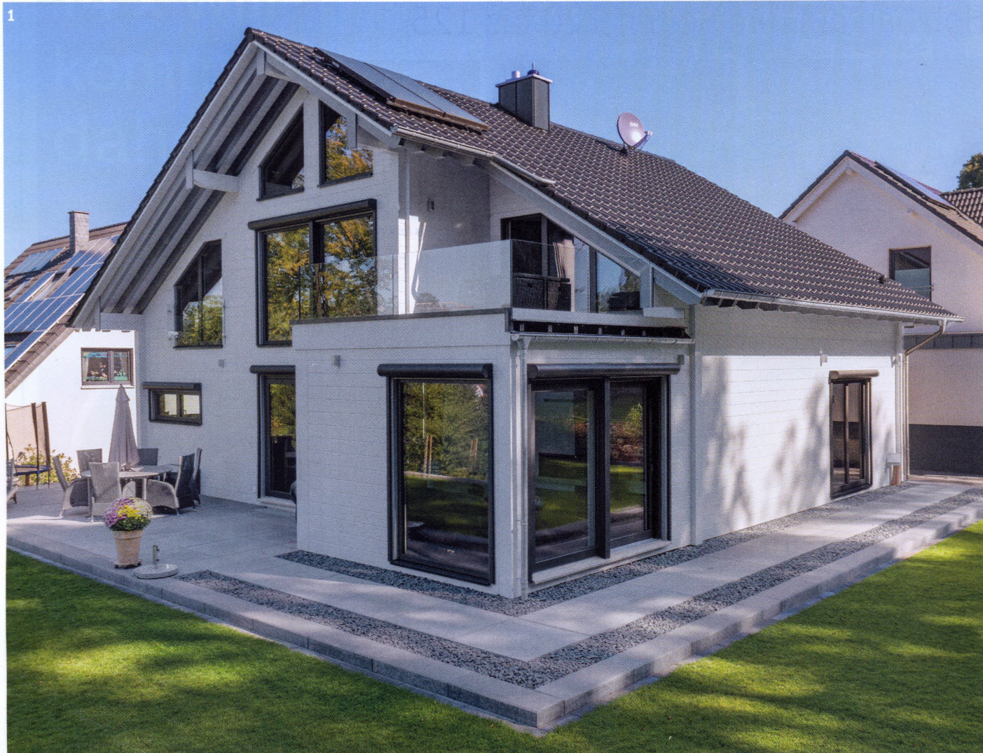
Ein Blockhaus in urbanem Look