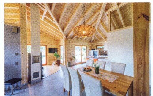
Firstoffen als architektonisches Gestaltungskonzept bringt sichtlichen Raumgewinn.

Glaselemente bis zur Decke geben einen ungewöhnlichen Blick auf den Dachstuhl und lassen mehr Tageslicht herein.